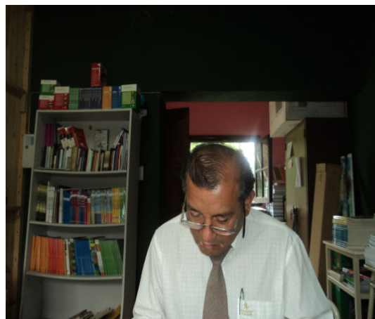
Escuela Secundaria de Amberes