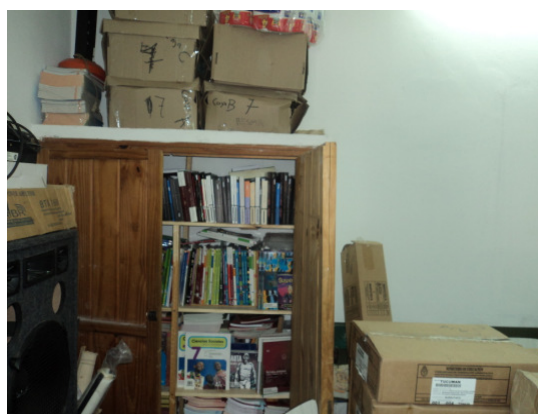
Escuela Secundaria Villa Benjamín Aroz