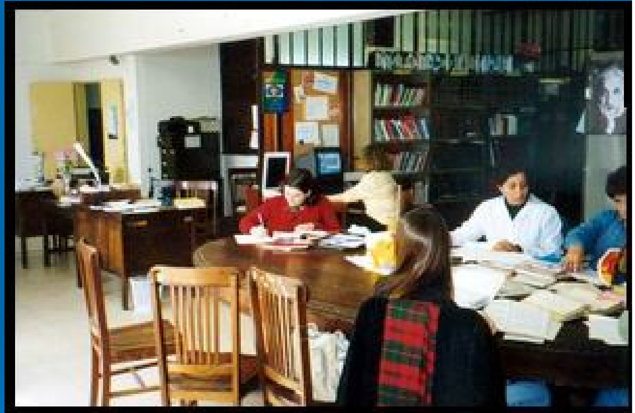
Biblioteca Provincial de Maestros de Córdoba