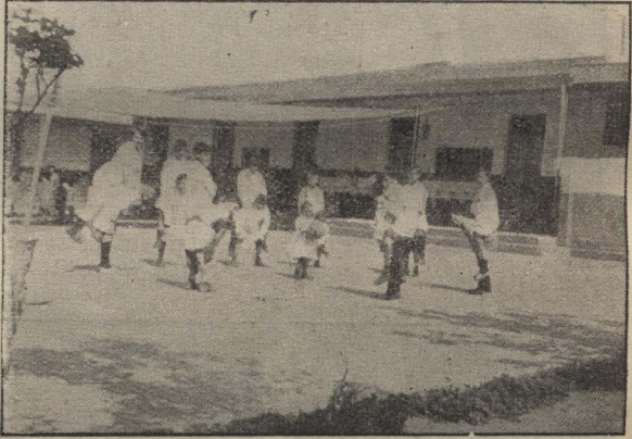
Niños jugando a la pelota a caballo.