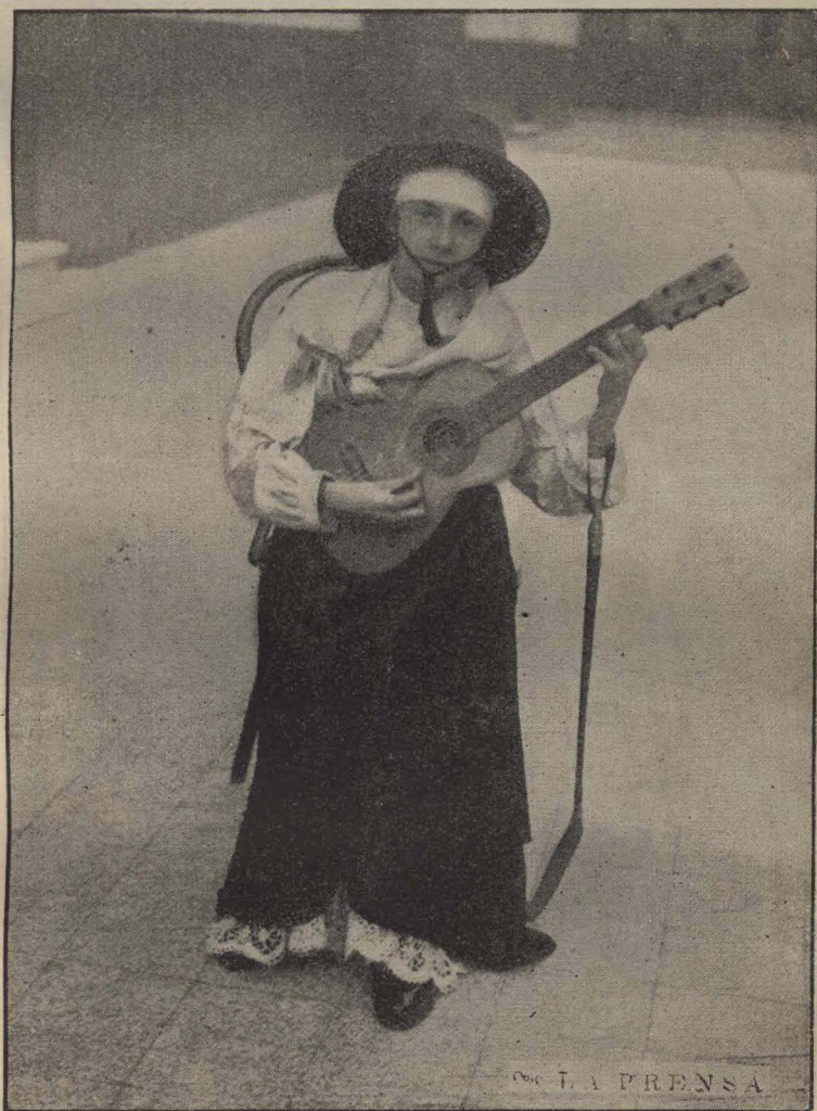
Pequeño intérprete en un canto nacional. — Escuela calle Piedras 1430.

En la escuela recreo de vacaciones ubicada en General Artigas número 1691, del C. Escolar 13.º, realizóse el 23 de enero últi-