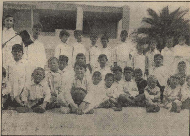
Niños descansando después de jugar un partido de pelota al cesto en la escuela General Artigas 1691