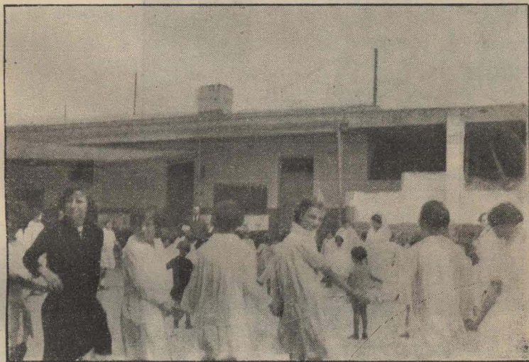
Niñas de la Escuela recreo de vacaciones calle General Artigas 1691, entonando una ronda infantil