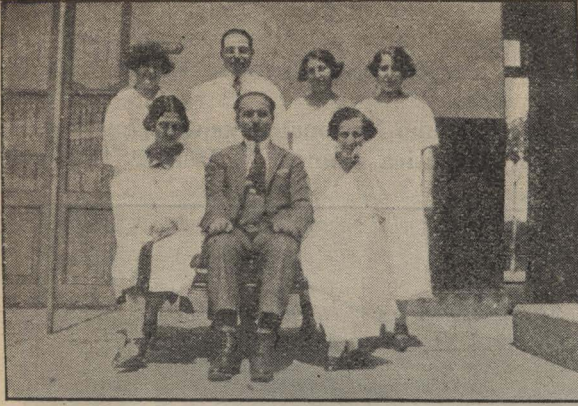
El personal de la escuela.