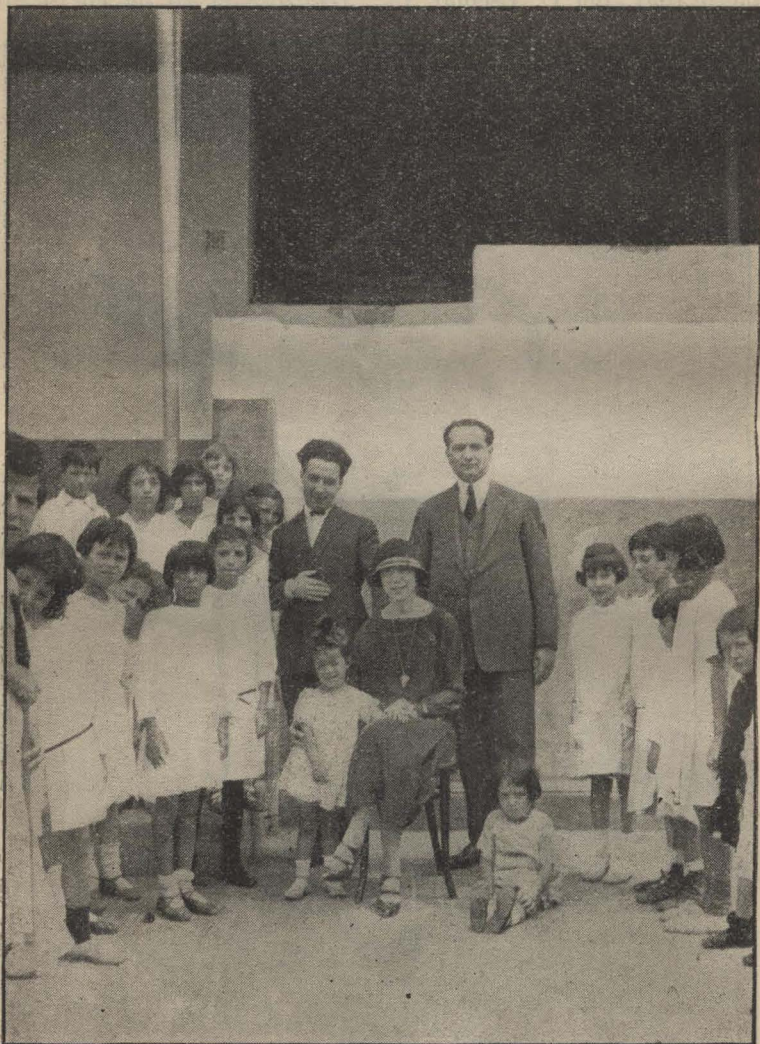
El director y varios maestros acompañando a un grupo de niños en el patio de la escuela General Artigas 1691