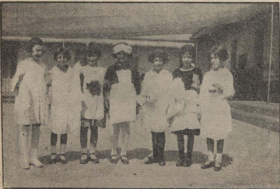
Niñitas que representan un juguete cómico.