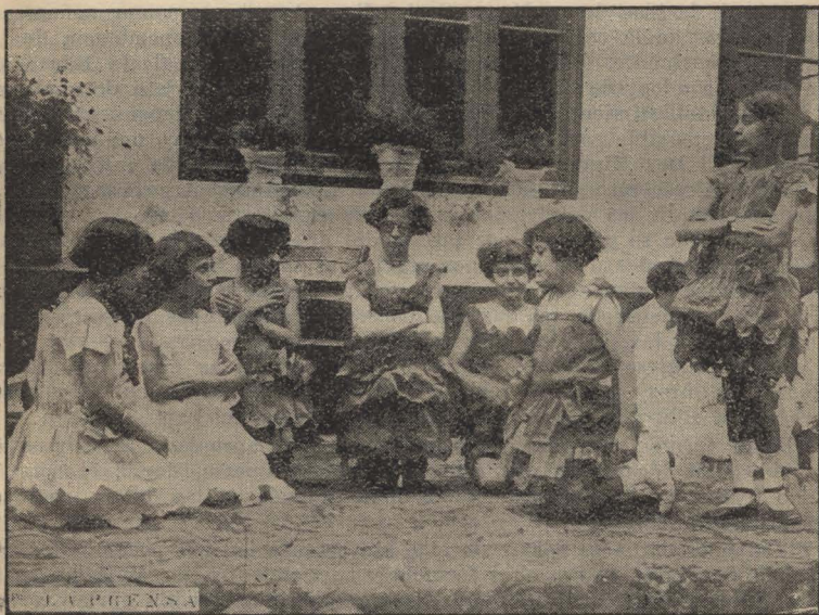
Niñas que interpretaron la comedia "Cuentos de hadas" en la Escuela recreo de vacaciones, calle Piedras 1430

Las escuelas recreo de vacaciones cumpliendo en toda su amplitud los propósitos de su creación, llenan cumplidamente un pro-