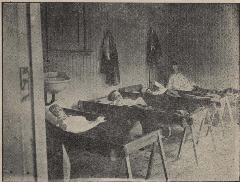
"Dormitorio de varones" Colonia de vacaciones

Pero hay una cosa más, quizá la más bella de todas, y es que las familias que pueden y viven en el campo o junto al mar, toman un niño a su cuidado durante unas semanas o durante el verano, proporcionándole un feliz y sano veraneo gratuito, que