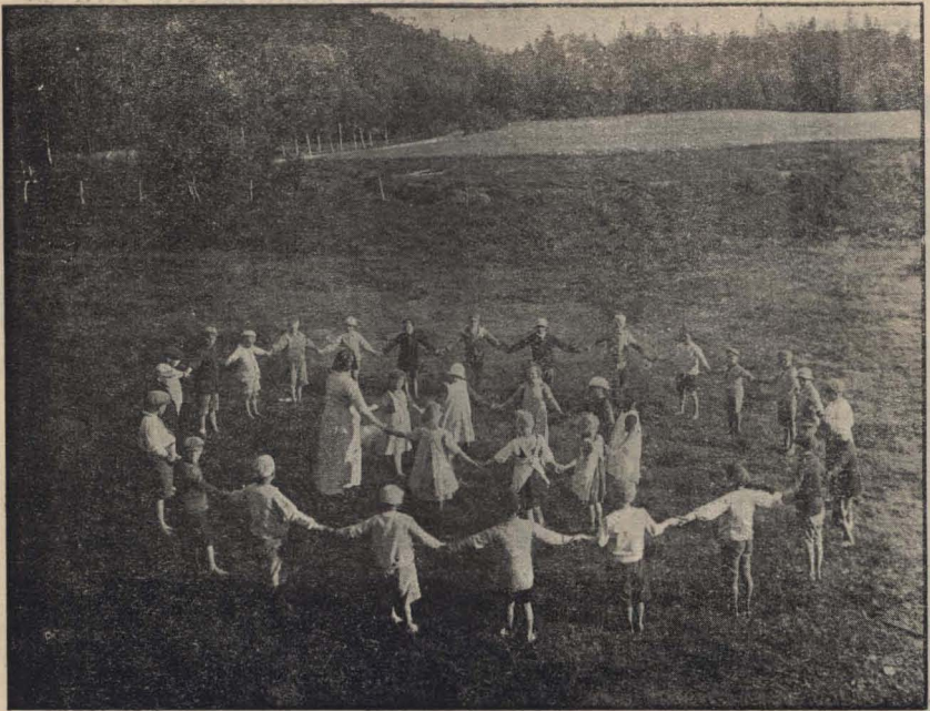
“Una ronda” Colonia de vacaciones

¡Se trabaja aquí, en conjunto y separado, tanto, para llenar esta brecha oscura, falta de aire y sol!... Ojalá algún día pueda ver en mi patria el mismo entusiasmo y la misma filantropía de nuestro pueblo en pos de un ideal tan noble como lo es, la salud y felicidad de la niñez. Ya sabemos que en Buenos Aires sobre todo, y en la República en general, se hacen todos los esfuerzos posibles, en este sentido, por parte de las autoridades; pero el pueblo mismo, no colabora suficientemente, una parte porque no llega a comprender el alcance de este problema y otra parte porque no quiere comprenderlo o lo que equivale a decir, no le importa. Es doloroso cuando los que pueden beneficiar, no lo hacen o lo hacen mal, pues es necesario obrar y que se vea el resultado de la obra hecha, pues, ¿para qué sirve plantar un manzano, si se deja