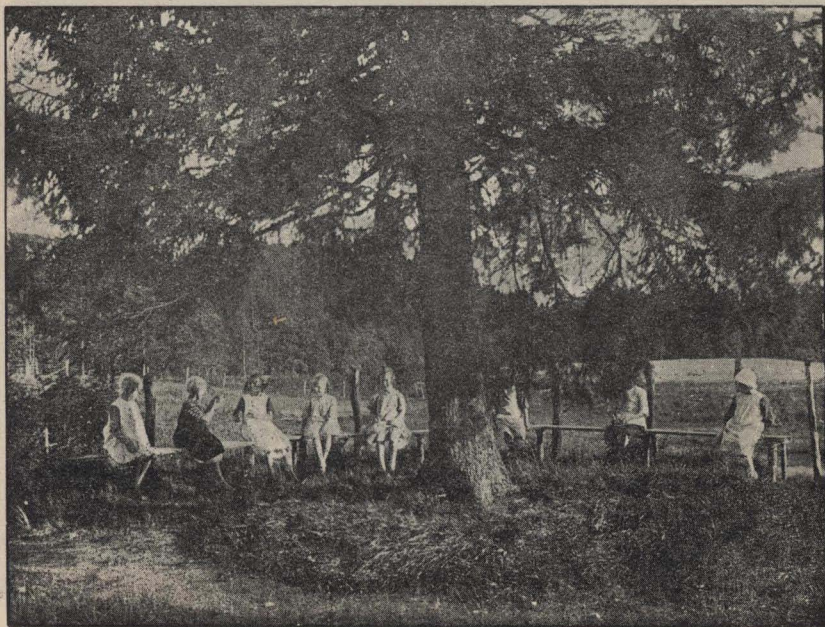
Niños de una colonia de vacaciones bajo un gran abeto

Es Suecia un país en que la naturaleza con mano pródiga ha derrochado sus dones. Los bosques, las montañas, los ríos o el mar se encuentran por doquier. En cualquier ciudad importante por poblada y comercial que sea, se encuentra sin andar mucho y gastando poco, aire puro, vivificador del alma y del cuerpo, y paisajes tan encantadores, que sólo el artista podrá hacerlo vivir en sus lienzos.