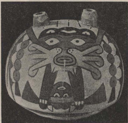
Botija decorada con brillantes colores.

Uno de los misterios que ha preocupado a los arqueólogos es que un centro de una cultura tan elevada haya estado ubicado en valles tan áridos como el de Nasca, donde casi no hay agua, rodeado por desiertos extensos, cuando por otra parte el descubrimiento de un cementerio tan vasto nos demues-