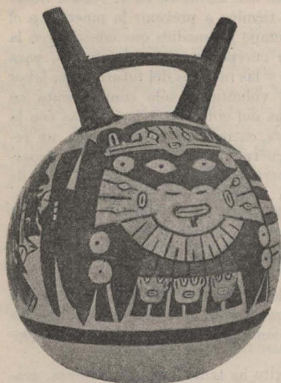
Vasijas con dibujos geométricos que se combinan para formar rasgos humanos.

Nada más delicado que estos magníficos recipientes se ha extraído hasta ahora del suelo del Perú, y sin disputa alguna pueden ser comparadas con los mejores objetos de barro descubiertos hasta el presente en Sud América.