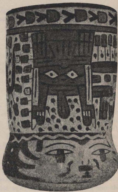
Una tinaja hallada en el enterratorio del Nasca.