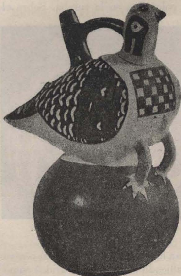
Representación de un ave en una de las vasijas indígenas.

Uno de los exploradores que más éxito ha tenido en esta empresa, acaba de descubrir uno de estos enterratorios en el que ha hallado una colección de hermosas vasijas de barro, de variadas formas y coloreados. Estas, fueron compradas hace poco,