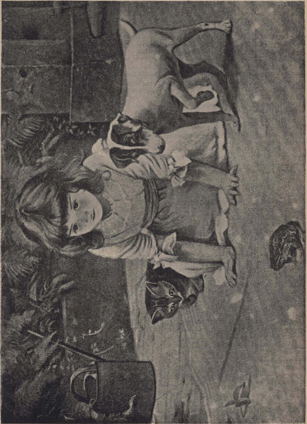
¿ AMIGOS Ó ENEMIGOS ?