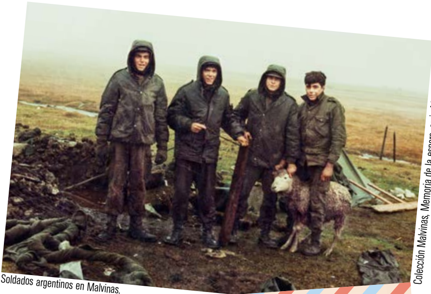
Soldados argentinos en Malvinas.

Colección Malvinas, Memoria de la espera, serie Martín Borba.