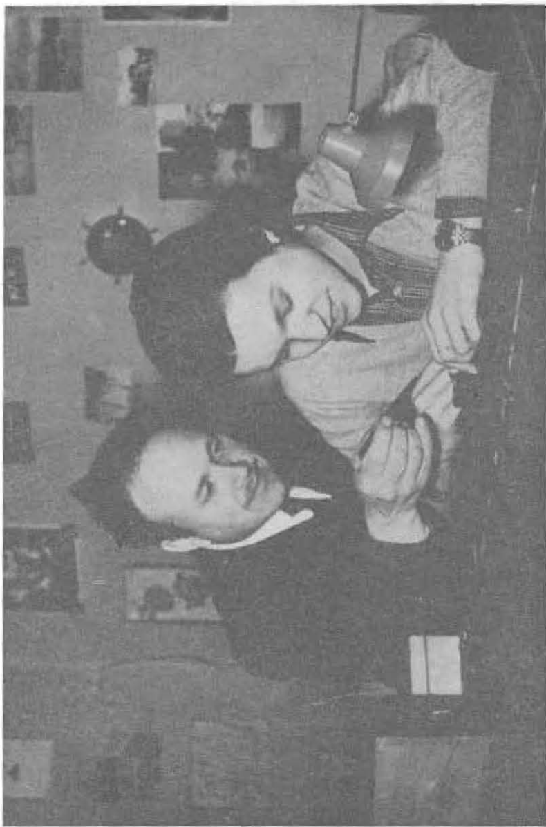
Escuela Domiciliaria. Relojería.