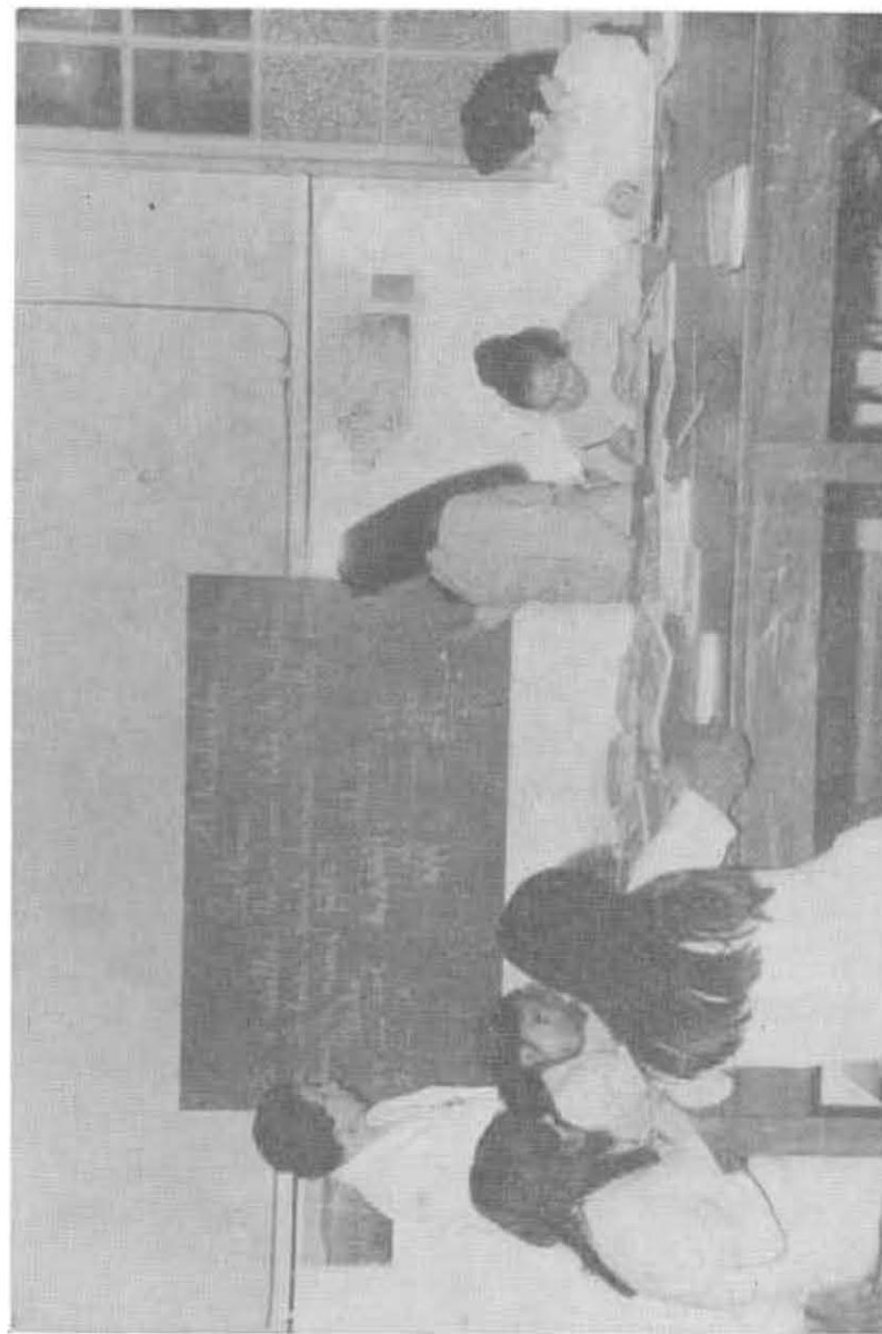
Escuela de Hospitalares. Escolarización en grupos.

Desde su creación hasta el 31 de diciembre de 1965 funcionaron en jurisdicción de la ex Inspección Técnica General de Escuelas Particulares e Institutos Educativos Diversos y, a partir de esa fecha, de la Inspección Técnica General de Asistencia al Escolar, que desde el 2 de enero de 1970 se denomina Supervisión de Escuelas Modales.