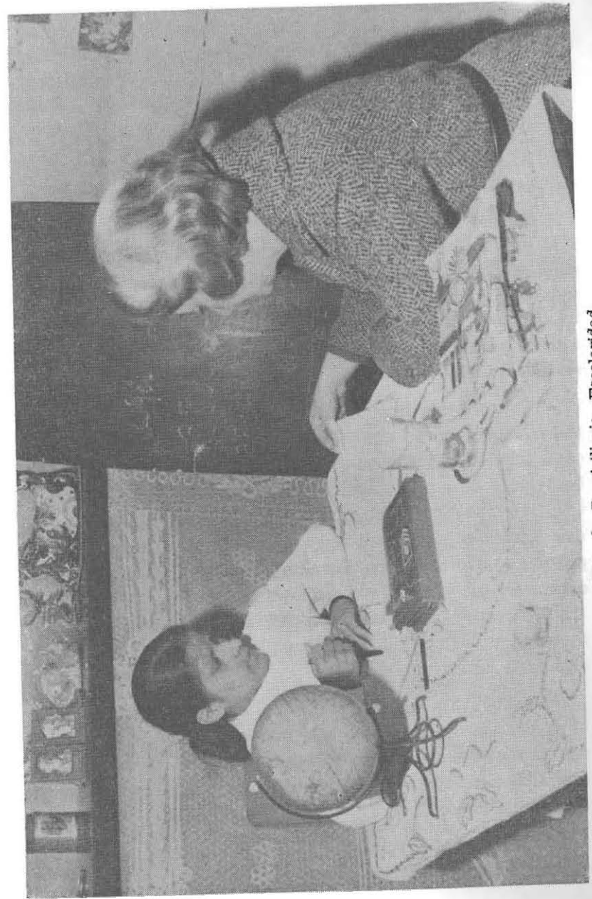
Escuela Domiciliaria. Escolaridad.

El trámite de inscripción se inicia con la presentación de una ficha solicitud firmada por el padre o tutor y un certificado otorgado por el médico, haciendo constar la dolencia por la que no puede concurrir a la escuela y el término aproximado de la recuperación en los estados no permanentes. Debe constar asimismo que el estado del alumno, en el momento de la inscripción, no reviste carácter de infecto-contagioso y que el proceso de la enfermedad no haya producido disminución mental.