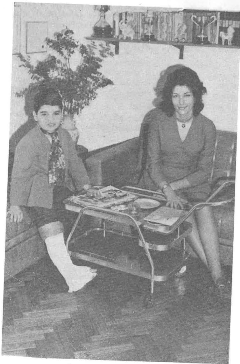
Escuela Domiciliaria. Dibujo.

El maestro que atiende niños en sus domicilios debe reunir condiciones especiales de carácter, buena salud, responsabilidad, vocación docente y de servicio, buena preparación pedagógica y espíritu de sacrificio que le permitan crear en su alumno conciencia de que cada individuo vale según su propia capacidad, inteligencia y esfuerzo personal en la lucha por la vida, con prescindencia de otros factores. Debe tratar de integrarlo con el resto de la comunidad para que no se sienta marginado, no obstante sus limitaciones.