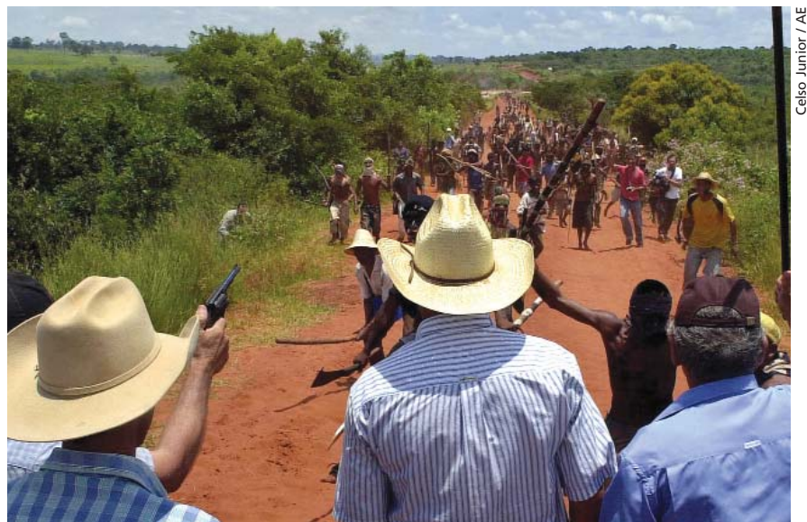
Enfrentamiento por tierras en Brasil.

común del discurso racista del desarrollo, el antropólogo Pacheco de Oliveira ha destacado que la mayoría de las tierras sin producción están bajo control latifundista. Esta circunstancia provoca una presión campesina que se intenta desviar hacia áreas "vacías" pero que, en realidad, están habitadas por indígenas. Por otra parte, la supuesta improductividad de la economía aborígena tiene que ver con que ésta no se orienta a la obtención de una ganancia, sino que se inserta en ciclos de reciprocidad que distribuyen la riqueza socialmente producida. Por eso, el derecho a la tierra, junto con el de autonomía, involucra la posibilidad de diseñar estrategias productivas sustentables basadas en las propias tradiciones culturales (etnodesarrollo). La lucha por territorios indígenas va más allá del reclamo de tierra que, en buena medida, también es extensible a campesinados de memoria no indígena (como los "sin tierra"). Se busca el control de un espacio —un territorio ancestral— que abarca el reclamo de autonomía política. La mayoría de las organizaciones indígenas reclaman territorios autónomos dentro del Estado, lo que implica el desafío de crear modos de ejercer la soberanía estatal más inclusivos y menos homogeneizantes. Este sería el objetivo político de máxima del EZLN, pero lleva un largo tiempo disipar la paranoia de los gobiernos que, con un ojo en las relaciones internacionales, no pueden entender el reclamo territorial más que como la altera-