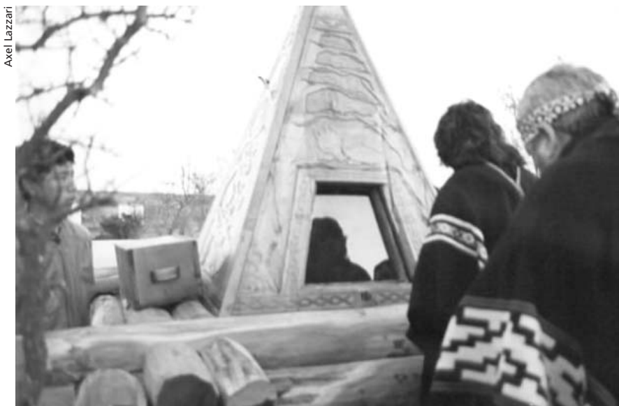
Repatriación de los ancestros. Los ranqueles muestran sus respetos al cacique Mariano Rosas.

Los indígenas no están "politizados" en el sentido peyorativo del término. Sólo quieren hacer cumplir sus derechos y crear otros, pretensión que por cierto exagera prevenciones respecto a que "se pasaron de la raya" o están comenzando a "faltar el respeto". Lo cierto es que los pueblos indígenas están adquiriendo voz y capacidad de acción política para mostrar en un nuevo escenario lo que desde la conquista, ¿infinita?, se impuso como una necesidad: articular una utopía de regeneración en las duras condiciones del despojo.