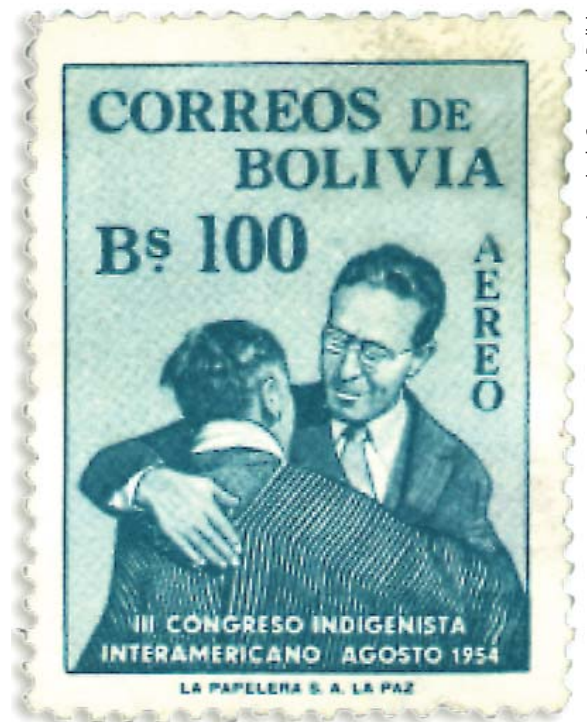
Asimetría indigenista. Un indio desconocido es abrazado por el presidente Siles Suazo.

¿Qué idea de nación conllevaba el indigenismo clásico? Con el objetivo de integrar a los indígenas, la nación era concebida como una comunidad aún en formación, por lo que debían subrayarse todos los rasgos que unificaban, descartando los que podían generar divergencias. En este modelo de nación los gobiernos fomentaban una sola lengua —el castellano o portugués—, una sola religión —la católica—, la idea de un territorio indiviso —la patria— y la noción de una única "raza" —la blanca o al menos el ideal racista del "blanqueamiento". Es tan cierto que la idea de nación ha sido la clave emancipadora del dominio colonial como