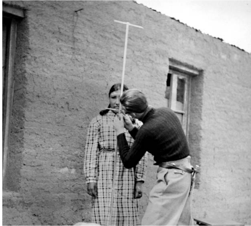
Museo Etnográfico / UBA

Entre los grupos en situación de subordinación dentro de una sociedad nacional, los pueblos indígenas u originarios –como también se autodenominan– son aquellos que se ven y son vistos como los descendientes de las agrupaciones que "estaban antes" de los procesos de conquista, colonización y nacionalización que desencadenó la expansión mundial de las naciones europeas. Indígena es toda persona que manifiesta descender de los pueblos y comunidades autóctonos que fueron vencidos y que hoy siguen sufriendo las consecuencias de esa derrota incesante. Ser indígena es tener algún tipo de conciencia de que la marginalidad y exclusión que afecta depende de que es autóctona, o sea, que sus orígenes culturales no se encuentran "afuera" de este continente ligados a los conquistadores y los inmigrantes. Pueblo indígena es una categoría político-cultural que remite a un conjunto de personas y grupos con capacidad de actuar y confrontar colectivamente sobre la base de intereses comunes, creencias y valores compartidos. En este sentido, es un error confundir pueblo indígena con "cultura indígena", "comunidad indígena" y más aún con "raza indígena", aunque estos términos aparezcan legitimando la acción de un pueblo indígena, del Estado o la sociedad. La relación de dominio que se establece entre las socie-