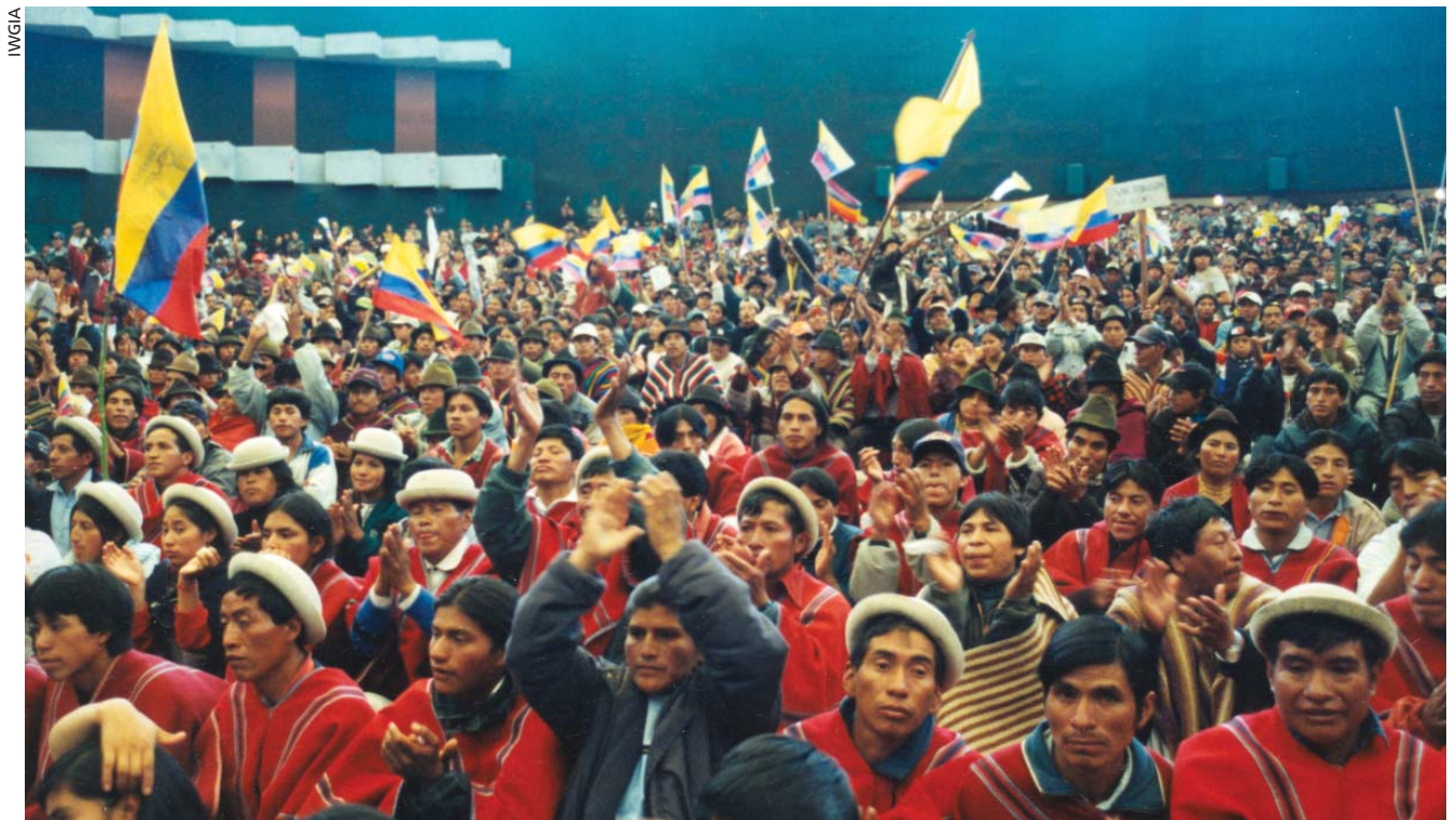
Reemergencia en tierras altas: organizaciones indígenas exigen la renuncia del presidente ecuatoriano Jamil Mahuad en el año 2000.

fomentó violentos procesos de "extracción" de riqueza y trabajo a través de empresas de colonización oficial o privada. En las fronteras, por su condición de tales, una vez más la "civilización" se antepuso como objetivo táctico a la "nacionalización", es decir, se privilegió la "humanización" de los "salvajes" sobre hacerlos "compatriotas". En esto sigue pesando el acendrado prejuicio acerca de los cazadores-recolectores que viven en ese hábitat y que suelen ser descriptos como holgazanes, improductivos y, por ello, mismo "salvajes" en comparación con las "civilizaciones indias" agrícolas y la sociedad industrial. Entre los muchos ejemplos de traducción de estos prejuicios en muertes, cabe mencionar la desarticulación demográfica y cultural de los xavantes luego de la apertura de la ruta transamazónica en el Brasil del milagro setentista o la migración desde los sesenta de los indígenas sin tierra de la sierra peruana, quienes, en busca de "oportunidades de progreso", se emplean en las empresas extractivistas de la selva y terminan enfrentándose con los indígenas que las habitan.