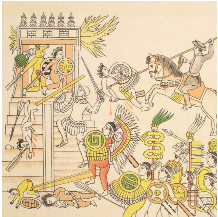
Guerra: pintores aztecas del siglo XVI representan el ataque al templo de Tenochtitlán, México (Códice florentino).

Abya Yala —término de los indios kuna utilizado hoy por el movimiento indígena