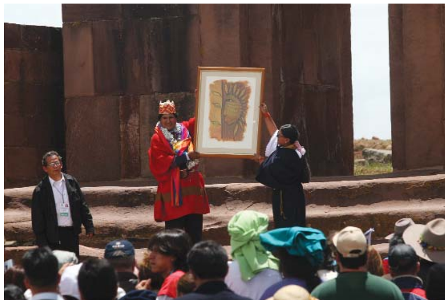
¿El gobierno boliviano en manos de un indio? El presidente Evo Morales es coronado "líder supremo" (Apu Mallku) el 21 de enero de 2006.

El reencantamiento de la memoria de esas épocas que se atisba en muchas de las demandas indígenas tiene, no obstante, sus límites. En primer lugar, como es evidente, hoy el reclamo se sostiene en la lucha por la autonomía basada en la identidad "propia", antes negada por el discurso del "campesino indígena" o el "indio nacional" del indigenismo asimilacionista. En segundo lugar, la actual reemergencia se distingue por poner en juego otros orígenes. En efecto, los procesos de nacionalización de indios antes referidos no se dieron del mismo modo a lo largo de América Latina. En muchas zonas coincidentes con las fronteras internas de los Estados nacionales, los indígenas conservaron, en los hechos, una mayor autonomía relativa, a pesar de que en esas áreas el Estado