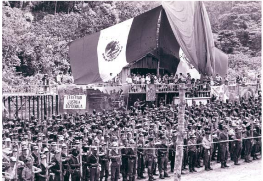
Indios y mexicanos, pero de otro modo. Formación del EZLN ante la bandera mexicana.

El derecho a identidad cultural supone una lucha por afirmarse y afirmar, contra los poderes vigentes, el valor positivo de las costumbres tradicionales y, en especial, las lenguas vernáculas, la espiritualidad y las visiones históricas indígenas. En el siglo XIX, cuando se le dio un sesgo antropológico al sentido de cultura, se pensaba que los indios "tenían" algo de cultura, pero no mucho. En el siglo XX, la antropología pensó que los indígenas constituían "culturas" diferentes, pero luego, por los procesos de colonización, "perdieron" esa diferencia cultural (se asimilaron y aculturaron como "campesinos", "villeros", etc.). Hoy la antropología y las ciencias sociales piensan que la cultura es un proceso de creación y recreación de formas de vida. Los pueblos indígenas se muestran como hacedores de cultura y, más precisamente, de su identidad a partir de lo que consideran su cultura. Las discusiones en torno a los programas de interculturalidad y bilingüismo en la educación, los proyectos de escrituración de lenguas orales, los talle-