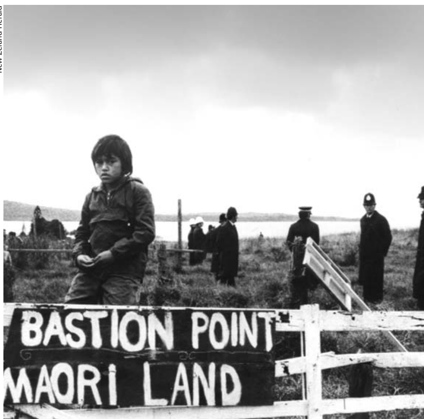
En todo el mundo los pueblos indígenas luchan por sus derechos, como los maoríes de Australia.

Por otra parte, pueblo indígena es una categoría jurídica de alcance mundial y aparece consagrada en documentos de la Organización Internacional del Trabajo y de las Naciones Unidas. Hay pueblos indígenas en todas las regiones del mundo donde se constate la lucha por los derechos por parte de poblaciones descendientes de pueblos autóctonos conquistados. Si en América Latina estos pueblos indígenas son los llamados indios , en Canadá se los conoce como