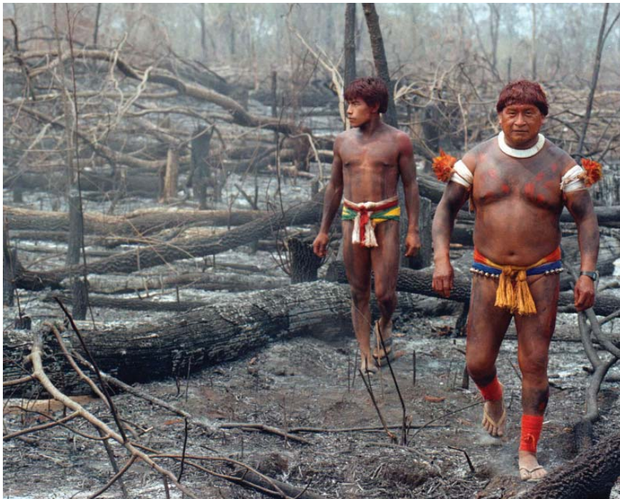
Indígenas deforestados (Brasil).

nes de la reemergencia fue el proceso de reforma del Estado. Hay que entender por ella un momento más del proceso formativo del Estado en América Latina en el que se redefinen los ejes de la dominación social y las coordenadas de gobierno en el contexto de una internacionalización acelerada de mercados, regímenes jurídicos y movimientos de protesta. Así, desde los años noventa puede observarse la paradoja de una "democracia neoliberal" que, mientras por un lado incentiva proyectos de participación, descentralización, autonomía, tolerancia y pluralismo, por otro "ajusta" al máximo la distribución de recursos sociales y económicos en la población. La retórica del Estado "eficiente" se traduce en una creciente marginación de los indígenas como ciudadanos y un veloz deterioro de sus condiciones de reproducción material y cultural. En efecto, han aumentado los ritmos de concentración latifundista en manos privadas (nacionales y extranjeras), pasando por encima de las tierras indígenas (por lo general ya transformadas en minifundios o con títulos precarios) y generando la expulsión de grandes números de campesinos que van a las ciudades, al extranjero o quedan como población "sin tierra". Esto, a su vez, provoca la baja de salarios y a la expansión del hambre en el