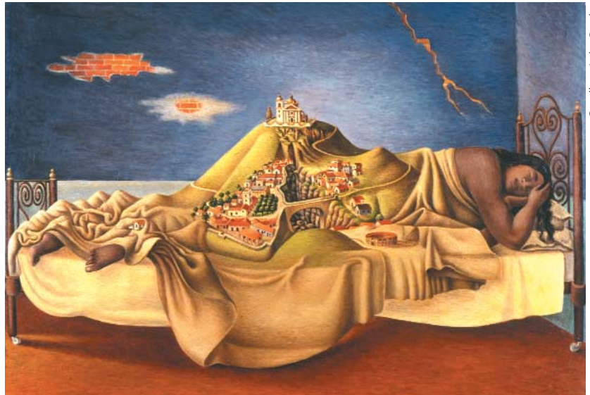
La nación mestiza mexicana y Malinche. Óleo de Antonio Ruiz, Sueño de Malinche , 1939.

Mestizaje es una noción cuyo uso sugiere significados contrapuestos. Del lado "oficial" y del sentido común, el mestizaje es una ideología de fusión de las diferencias (biológicas y culturales). Del lado "crítico", remite a un proceso abierto de diferenciación constante donde no hay punto de fusión, ni crisol posible. Las naciones latinoamericanas edificaron sus ideologías nacionalistas sobre la primera noción de mestizaje, elevando las ideas y valores de lo mestizo –llámese criollo, cholo o ladino– a símbolos de sus nacionalidades. Bajo esta aparente democracia se encubren otras posibilidades identitarias, pero, sobre todo, se desconoce el proceso de diferenciación social y cultural que hace surgir "diferencias" impensadas. El punto clave de esta ideología es el establecimiento de una jerarquía entre los tipos de fusión deseables y los grados de esa fusión. Así, bajo la noción genérica de mestizo puede entrar el patrón criollo –criollo por ser americano–, el profesional liberal "gringo" –criollo por aclimatado o hijo de inmi-grantes–, el mestizo propiamente