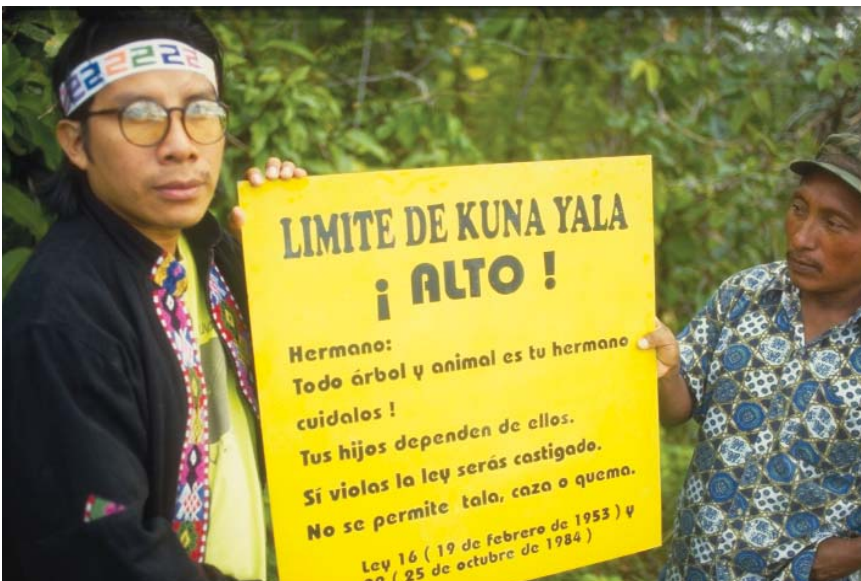
No bastan las leyes. En Panamá, los kuna hacen cumplir la demarcación de sus territorios.

pues, que la determinación de "quién es quién" es, ante todo, un hecho político de la reemergencia en la que están involucrados tanto indígenas como no indígenas, ya que de la identificación de los sujetos y de su peso demográfico dependen la asignación de recursos, el diseño de políticas públicas y las estrategias de legitimación de los propios indígenas. La lucha por el reconocimiento legal del principio de autoidentificación —considerado un derecho humano— sólo se entiende en el contexto de fortalecimiento de la conciencia indígena que deja atrás el estigma que antes obligaba a esconder la indianidad.