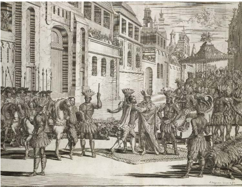
¿Moctezuma vasallo voluntario del rey de España? Grabado español del siglo XVIII.

En contraposición a estos modelos de incorporación se destacan los vínculos entablados con las sociedades que permanecieron en los márgenes, pero no ajenas al sistema colonial; vínculos que se dieron mediante guerras, comercio, alianzas políticas y movimientos demográficos. En esta situación se encontraban los llamados indios alzados , bravos o aucas . Entre ellos estaban los avá-guaraníes (chiriguano) y los guaycurúes (genérico que incluía a tobas, abipones, mocovíes, pilagá, entre otros) que habitaban el Gran Chaco; los mapuches, pampas y tehuelches de la Pampa, la Patagonia y la Araucanía; los chichimecas que vivían en el norte de Nueva España (México) o los chunchos de las selvas que bordeaban los virreinos del Perú y Nueva Granada. Eran todos ellos "indios de frontera", participantes en ese espacio de relaciones interétnicas que también incluía a mestizos, esclavos negros escapados y