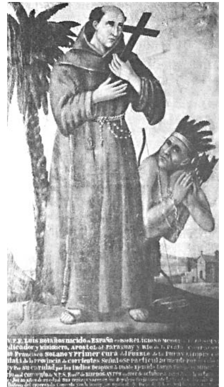
Siervos de Dios, amos de indios.

Los guaraníes que habitaban en las cuencas de los ríos Paraguay y Paraná fueron sometidos por los españoles a través de encomiendas, especialmente la llamada encomienda originaria por la que se otorgaba diez o más mujeres indias a un conquistador. Luego, los jesuitas, aprovechando el